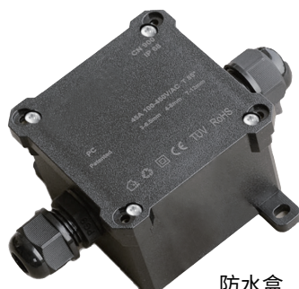
防水盒 (IP68, PC材質)