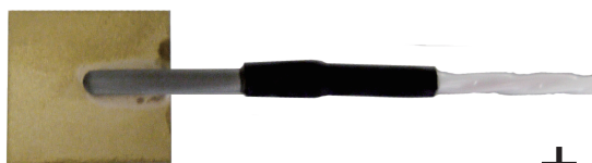
太陽能專用貼片式感溫計