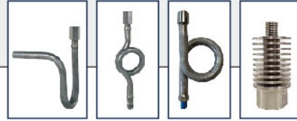
●U type ●Coil ●Pigtail ●Fins